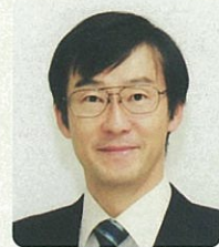
愛知県生コンクリート 品質管理監査会議

今後も品質の信頼性を高め、安心して使用できる生コンクリートとするために、監査制度のより充実した運営に努めてまいりたいと存じます。今後とも、皆様のご理解、ご支援をよろしくお願い申し上げます。